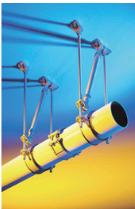
Sistem obežanja na strop je standardizirana rešitev