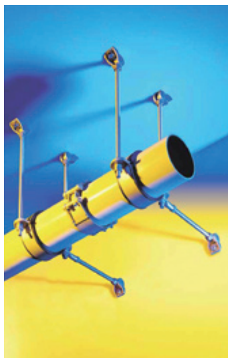
Z enakimi elementi je možno na enostaven način rešiti različne pritrdjevalne naloge